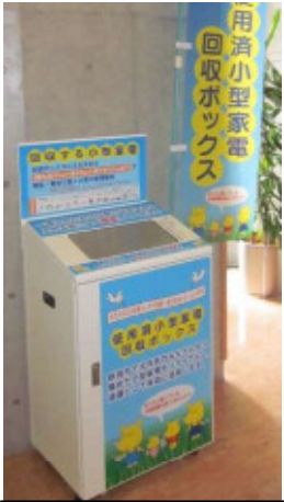
回収ボックス外観