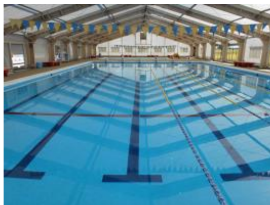
B & G海洋センター プール