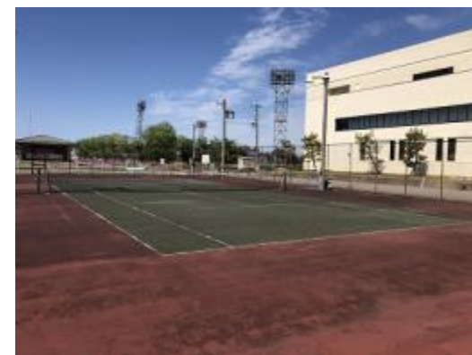
テニスコート ハード 2面