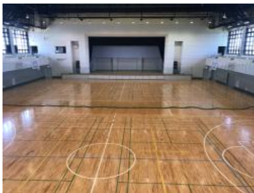
体育館(ランニングコースあり) バスケットコート2面