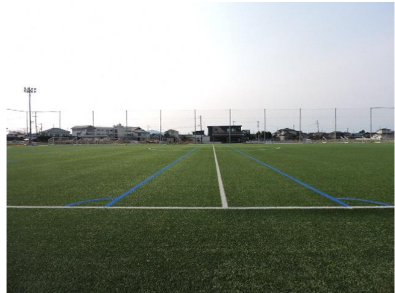
人工芝サッカーコート 1面