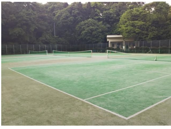
緑地広場テニスコート 人工芝3面