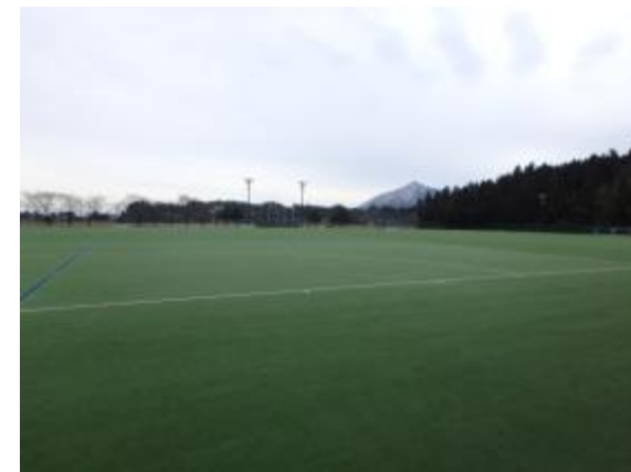
多目的広場 人工芝 ホッケーコート2面