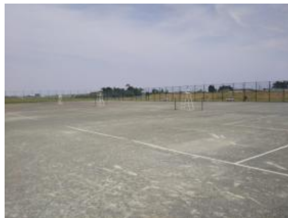
テニスコート グリーンサンド 7面