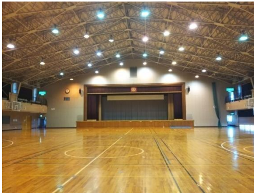
体育館 バスケットコート2面