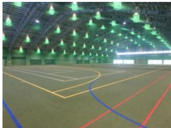
屋内コート 人工芝 テニスコート3面