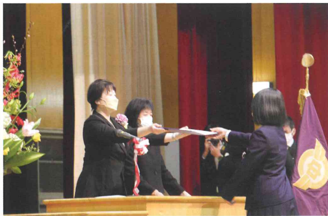
▲西川中学校卒業証書授与式(3月2日)

■西川地域の総人口:10,668名(-26名) ■男:5,158名(-12名) ■女:5,510名(-14名) ■世帯数:4,046戸(+8戸)