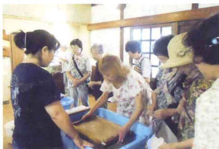
紙すき研修会 すいた紙の作品は文化祭へ

西川老協 絵手紙部は、平成15年に活動を始め、今年20年となる高齢者ぞろいの絵手紙大好き人間の会です。