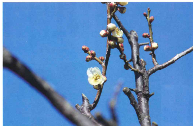
▲青空に映える梅一輪(東町)