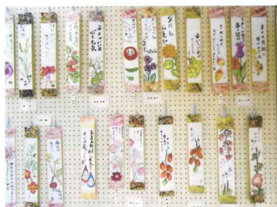
展示会 その後、友愛訪問のプレゼント