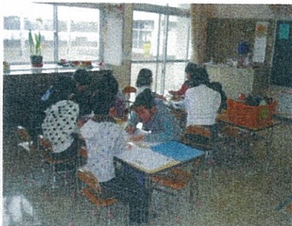
静かに朝学習。わからない所はお互いに教えあいます