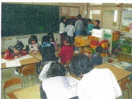
ピアノ練習もやさしい音で隣室の園児にも気配りします