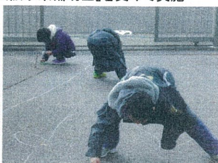
園庭いっぱいにお絵かきチョークも沢山使いました