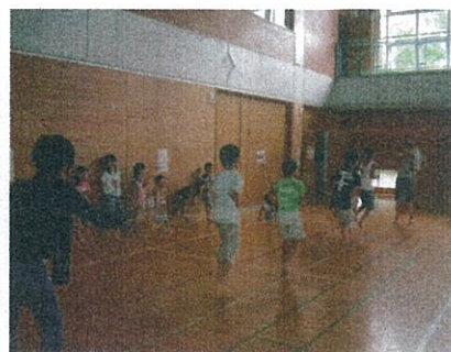
体育館を一杯に活用して遊びます 時には男女一緒に縄跳びも