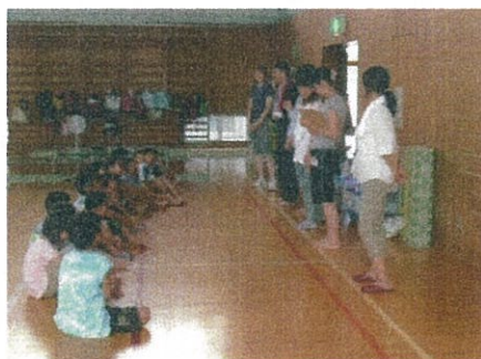
朝のミーティングで一日の始まり その日の担当者の自己紹介も

◎ 越前小学校の夏休みに低学年の子どもを預けたいという多くの地域保護者からの要望があり、子ども育成部は7月23日(月)から8月29日(水)の間、越前小学校体育館を借用して学童保育を行いました。市の補助金の支援、小学校からの支援、指導員や保護者やボランティア等多くの支援をいただきました。子どもたちはのびのびと約一ヶ月楽しみました。事故も無く有意義な時を過ごすことができました。勉強、運動、水遊び。大人も子どもも汗びっしょりの毎日でした。大きなイベントも2回ありました。保護者の方も、何とか都合をつけてくれた指導員や多くのボランティアの皆さんありがとうございました。新潟市の「にいがた安心ささえ愛活動支援事業補助金」を受けて実施