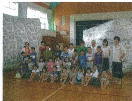
出来上がったエアードーム の前で記念撮影