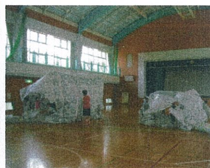
待ちに待った全員脱出 最後は新聞紙が粉々に