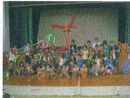
エンジェルさんと素敵な作品と 自分で作った作品と記念撮影