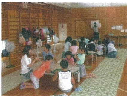
静かに朝学習。終わった人は 迷惑にならないようにします