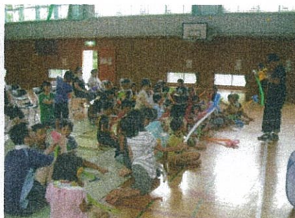
皆でバルーンアートに挑戦 なかなか難しく大苦戦