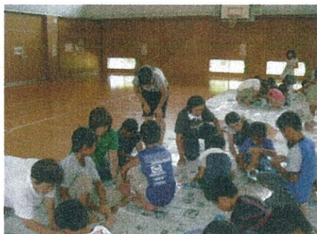
新聞紙エアードームづくり 空気が漏れないよう協働作業