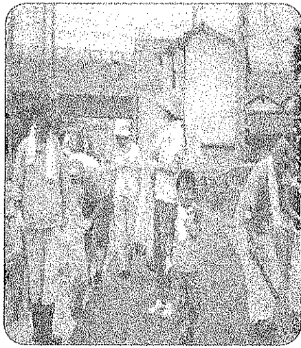
三世代揃っての清掃奉仕も