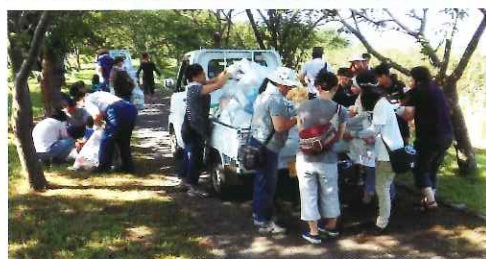
(昨年の後片付けのようす)