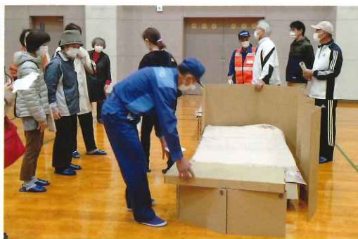
段ボールベッドの感触体験

※災害はいつ起きるかわかりません。 家族で防災について話し合う機会を作ってみませんか？