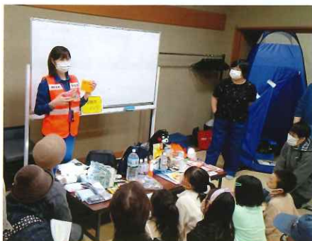
非常持出品についての説明