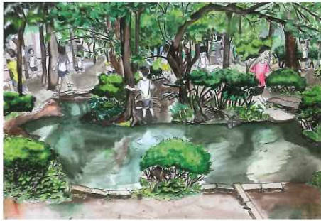
「昼休みの『みどりの丘』」