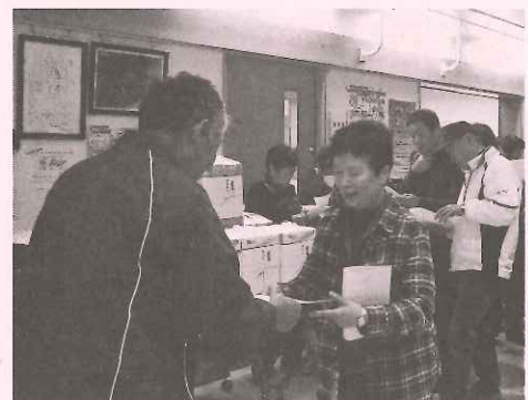
今回は優勝を目指すぞ～

ワクワクドキドキの楽しい大会で、表彰は全チームが何がしかの景品が当たります。優勝を逃したチームは来年こそは良い結果を出すとの気概で表彰式に望んでいましたので、主催者としても頼もしく思い今回の大会を終了しました。