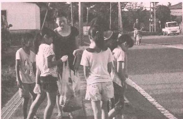
一斉クリーンデーでゴミ拾い 私が捨てたゴミかな

早朝の僅かな時間でしたが、黒埼南部公民館周辺を清掃場所にして30人程の方から汗をながしていただきました。大変ご苦勞様でした。