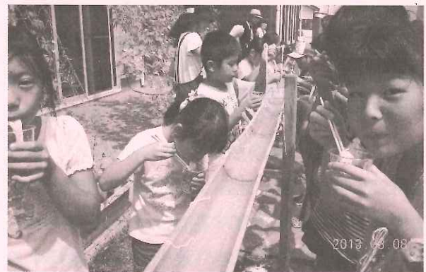
ソーメンでこんなにおいしかったのか〜

2回目となる今回は、ソーメン流しの土台となる竹や足場等を新調しましたので、手前味噌ですがプロの仕掛けの様でした。南小学校の先生による化学実験とソーメン流しがセットの企画です。保護者の方や自治会スタッフの皆さんのご苦勞を思うと申し訳ないなーと思うのですが、子ども達の屈託のない笑顔をみると来年もやってあげたいと思うばかりでした。