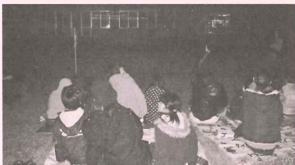
泉先生の指導のもとで星座を観察中です