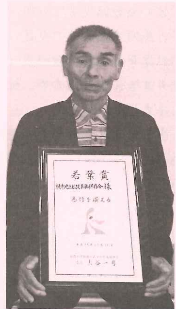
青少年健全育成大会にて

この様な永年の指導的活動に対し昨年11月30日、黒埼地区青少年育成協議会より若葉賞の団体表彰が授与されました。