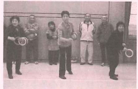
真剣に投げているが成績が…