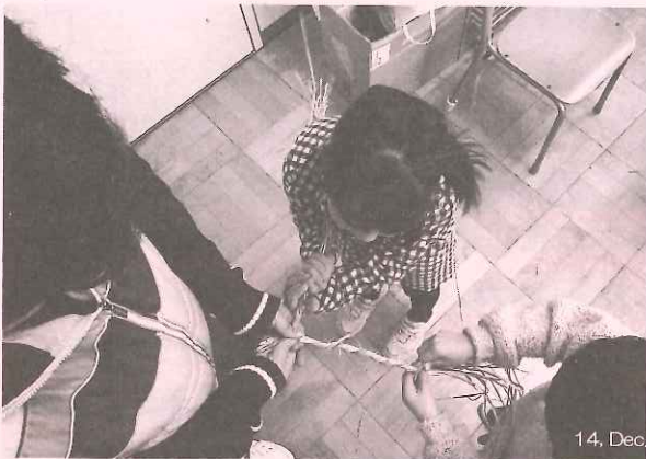
正月飾りは縄縫いから