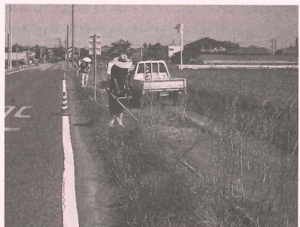
あっちえ〜中、頑張った草刈り

作業は真夏の猛暑の中で実施しますので、暑くて大変ですが、子ども達の安全のためと思い頑張って作業を行っていただきました。