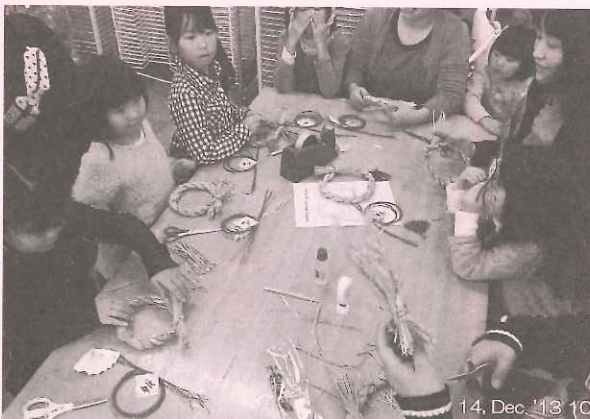
素敵な正月飾りがもう直ぐ出来上がる