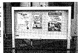
木場八割自治会の掲示板

この掲示板は、市役所を始めさまざまな関係機関から広報伝達の手段としてポスター、文書等の掲示物を掲示する施設として設置されました。掲示内容は、自治会長が管理することとして、公共の秩序を乱すおそれのあるもの、政治活動または宗教活動に係るもの、営利を目的としたものについての掲示物は、掲示できないとしております。また、掲示板に掲示物を掲示しようとする者には自治会長に申し出るようになっております。今まで掲示板が設置されていなかったこと自体が不思議であったと関係者は語っており、遅ればせながらの設置を歓迎しております。