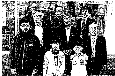
提言を終えて記念撮影

今後は学校とも連携しながら、地元の方々を中心に道路清掃や花の植栽を実施していく予定とのことです。