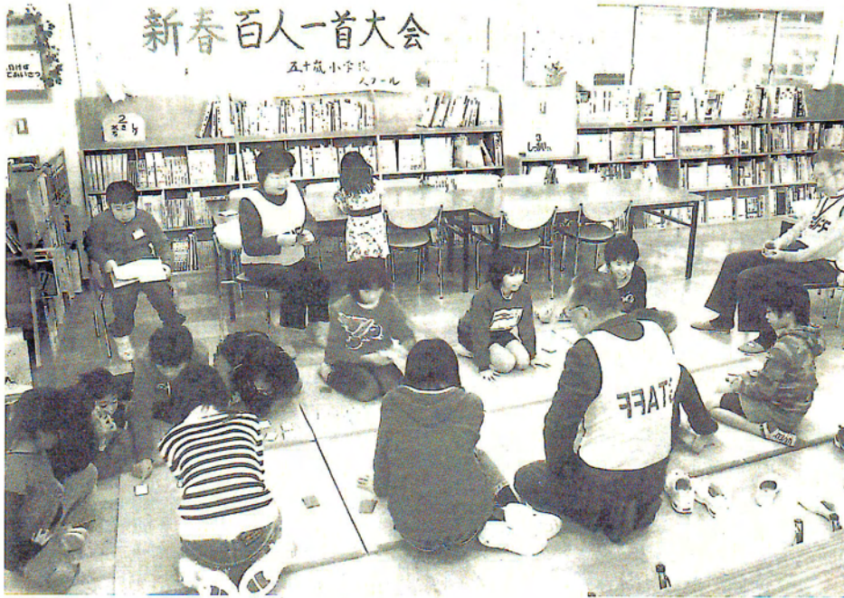
新春百人一首大会

先進の東青山 小学校の活動な どを参観しつ つも、暗中模索の 中での出発でし た。しかし、運 営スタッフの方 々の工夫と努力 で、順調に推移 してきました。 なによりも嬉 しいことは、参 加している子ど もたちが、とて