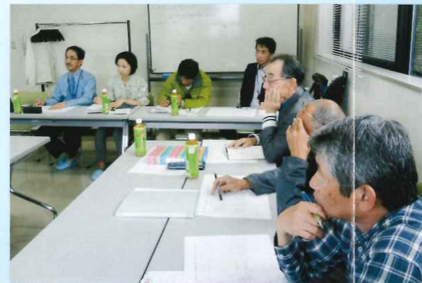
● 思いは一つ街づくり知恵を出し合い考えて