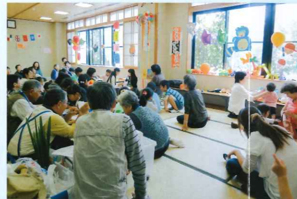
● 地域で育てる子供はみんなの宝(ふうせんクラブ)