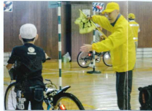
● 学校と一緒に学ぶ自転車安全乗り方教室