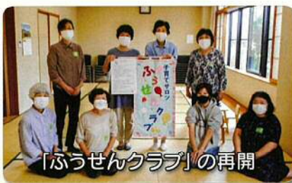
「ふうせんクラブ」の再開