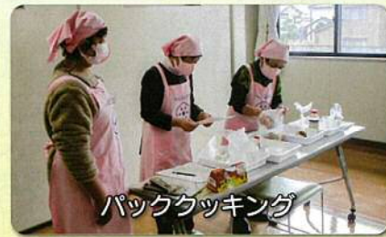
バッククッキング