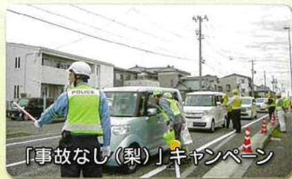
「事故なし(梨)」キャンペーン