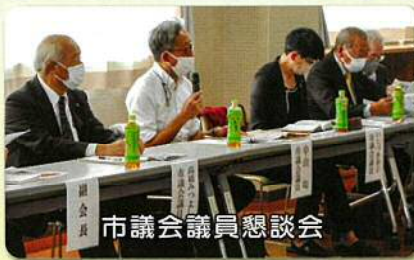
市議会議員懇談会