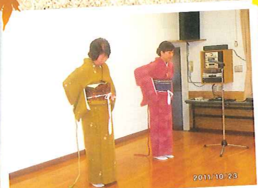
きもの着付け・藤の会