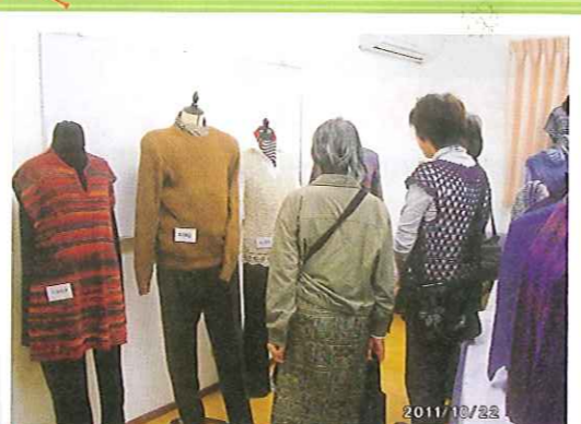
第1・第2 編み物教室