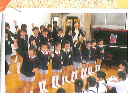
聖園マリア幼稚園