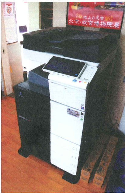
新しく導入したカラーコピー機

停電事故は電柱からの屋内引込み線が何らかの原因でショートし、異常電流が館内を駆けめぐり、和室の暖房二機、事務室の暖房一機、廊下の非常灯と門灯が故障し、和室利用者には数日間迷惑をかけた。突然の事故でしたが、常備の懐中電灯、「東北電力コールセンターフリー