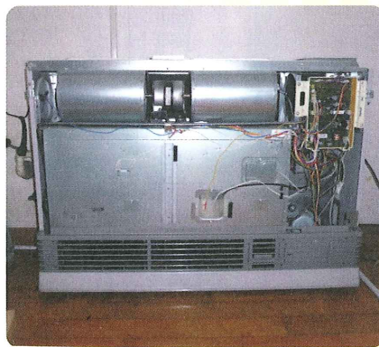
故障した暖房機器

落雷で損傷したコピー機に替えてカラーコピー機を新しく導入しました。この新設に伴いコピー代金を改定しました。モノクロ5円、カラー25円です。