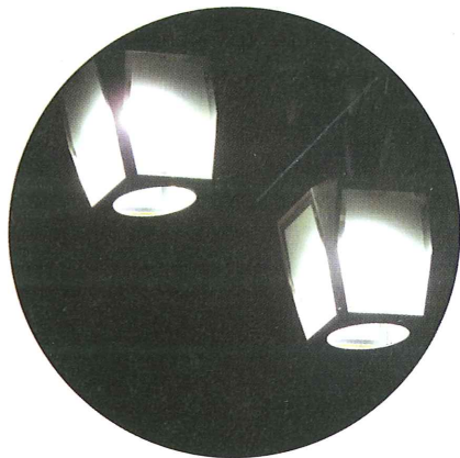
夜間の商店街を煌々と照らし出すLED街路灯。