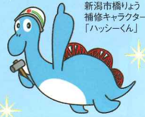
新潟市橋りょう補修キャラクター「ハッシーくん」