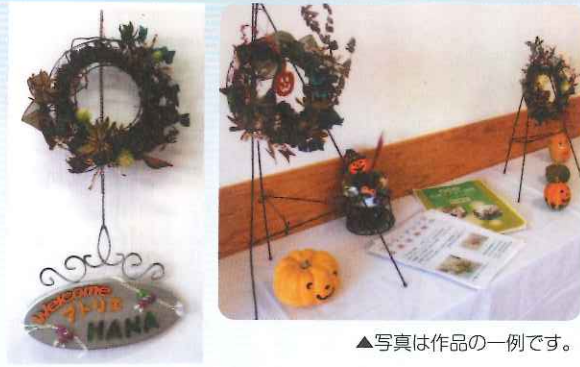
▲写真は作品の一例です。