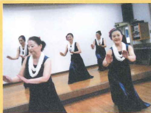
フラダンス カ・フラ・オ・ナー・プ・ア・ケア