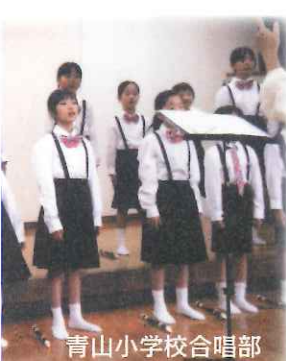
青山小学校合唱部