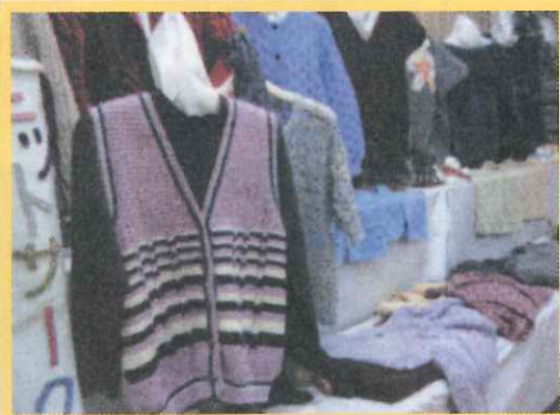
火曜ニットサークル