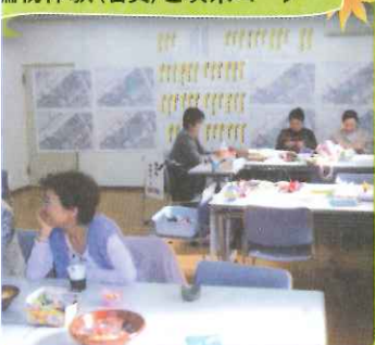
扁物体験(右奥)と喫茶コーナー