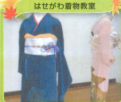
はせがわ着物教室