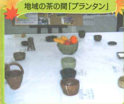
地域の茶の間「プランタン」