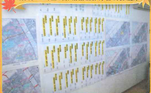
青山小4・5年生の防災標語と防災学習の発表記録