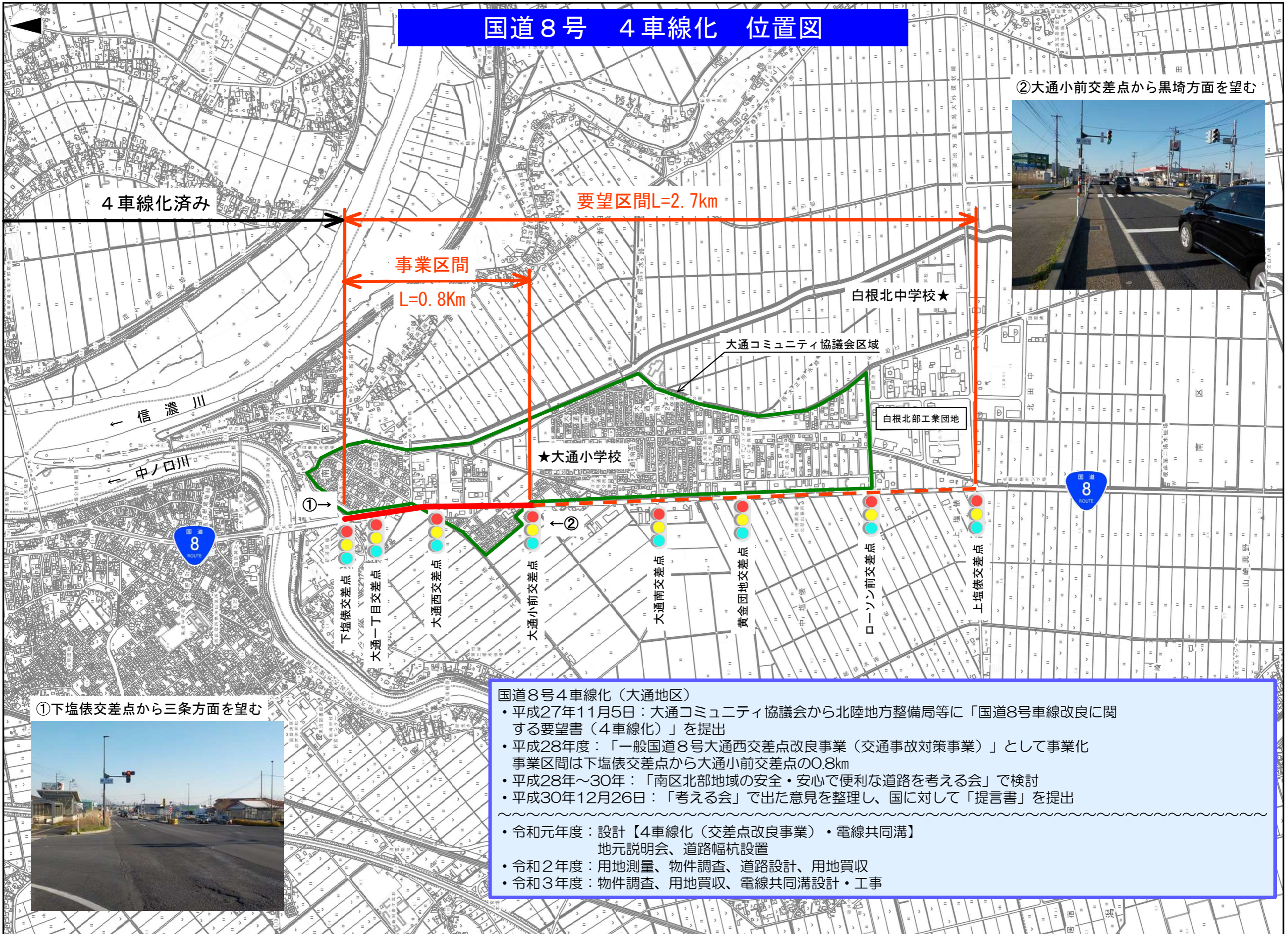
②大通小前交差点から黒埼方面を望む