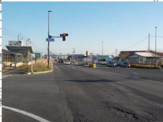
①下塩俵交差点から三条方面を望む

国道8号4車線化（大通地区） 平成27年11月5日：大通コミュニティ協議会から北陸地方整備局等に「国道8号車線改良に関する要望書（4車線化）」を提出 平成28年度：「一般国道8号大通西交差点改良事業（交通事故対策事業）」として事業化 事業区間は下塩俵交差点から大通小前交差点の0.8km 平成28年～30年：「南区北部地域の安全・安心で便利な道路を考える会」で検討 平成30年12月26日：「考える会」で出た意見を整理し、国に対して「提言書」を提出 令和元年度：設計【4車線化（交差点改良事業）・電線共同溝】 地元説明会、道路幅杭設置 令和2年度：用地測量、物件調査、道路設計、用地買収 令和3年度：物件調査、用地買収、電線共同溝設計・工事