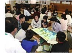
保護者や地域の方々などと意見交換する子どもたち