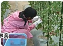
アグリパークでの収穫作業