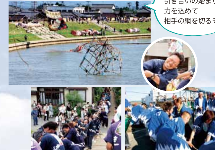
堤防の下まで網を引く行列ができます。