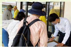
スマホ講座受付の様子

今年度、新規全校ボランティアとして参加した「白根のまち歩き×スマホ講座」は、5月から全4回開催されました。受付係の仕事や受講生が撮影する際の安全確認補助だけでなく、講座に同行したことで、スマートフォンでの写真の撮り方も学べ、得るものがたくさんある実りある活動でした。