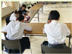
川柳を作成の様子

ヤングボランティア(南警察署から委嘱)では、特殊詐欺被害予防活動として「だまされま川柳」を作って応募し、川柳で被害予防に取り組みました。先日、ヤングボランティアの活動についてラジオ取材を受け、生徒会長が活動について紹介しました。生徒たちの日々の頑張りを広く皆さんに知ってもらい、とても良い機会になりました。