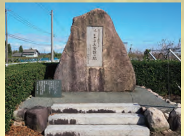
ルレクチエ発祥の地の碑

この内の2本がリスク分散の観点から、現在の場所に移植されましたが、時が経つうちにきょうだい木は枯れてしまい、現存しているのはこのシンボル樹だけになりました。