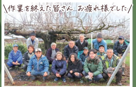
作業を終えた皆さん お疲れ様でした!