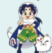
しろね大凧と歴史の館 キャラクター大空トイカ&ねこ太

○テイクアウト屋台の出店 ☎8月7日(土)、8日(日・祝)、9日(月・振休)、14日(土)、15日(日)、21日(土)、22日(日) ☎同館 ☎372-0314