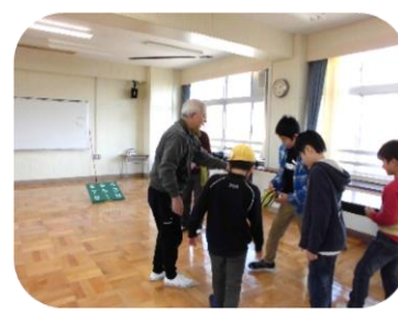
紙ヒコーキを作って飛ばそう！