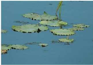
緑に輝く佐潟のハスの葉 2015.6

春の訪れとともにハクチョウは北へ帰りました。春、佐潟公園の桜は満開で楽しみました。5月中頃からハスやヒシの葉が出始めました。今では湖面に広がってきています。佐潟周辺では、田んぼの田植えは終わり、スイカ畑で農家の方がスイカの出荷作業を行っています。この時期、繁殖に渡ってくるオオヨシキリがヨシ原でにぎやかに鳴いています。また、セスジイトトンボなどのトンボ類も見かけるようになりました。今年はどうな風景が見られるのか、観察していきたいと思います。