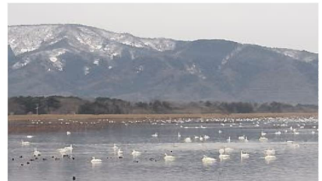
佐潟で羽を休めるハクチョウ 2015.1

10月中旬に潟の上空を飛ぶコハクチョウが初認され、佐潟に冬鳥の飛来がはじまりました。その後、積雪はほとんどなく、安全な生息地として潟で羽根を休める姿が観察されました。3月初めには、北へ旅立って行きました。