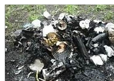
佐潟公園内に捨てられていたゴミ