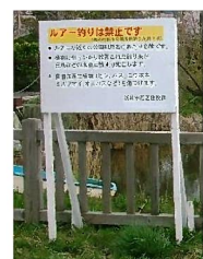
ルアー釣り注意看板