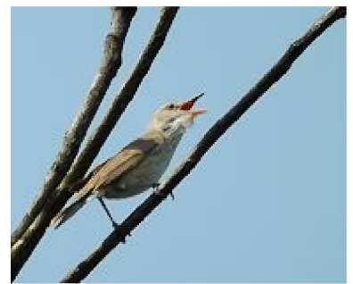
初夏を迎える頃にやってくるオオヨシキリ 2015.6