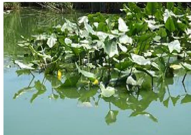
水上で咲くクウホネ 2015.6