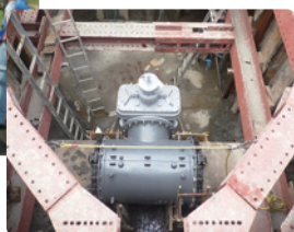
水道施設の耐震化