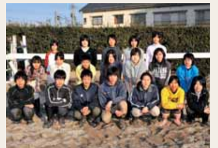
「新潟乗馬スポーツ少年団」の皆さん

国体の正式競技でもある馬術。メンバーの中には、国体を目指して毎週練習に励んでいる子もいます。