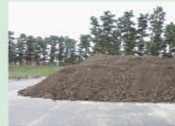
山積みされた浄水発生土（写真3）