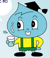
マスコットキャラクター 水太郎