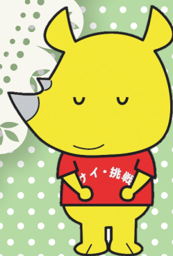
新潟市ごみ減量推進キャラクター サイチョ