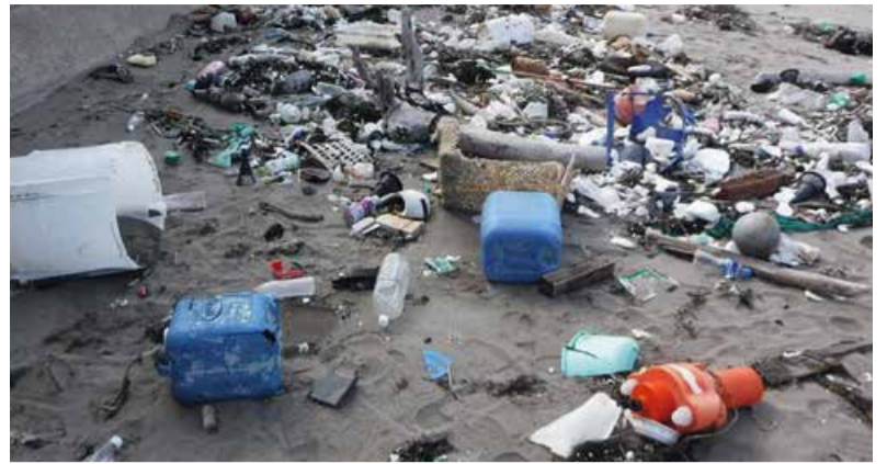
新潟市の海岸のようす

対策としては、 プラスチックごみの削減 や リサイクルの推進 が有効だと言われています。