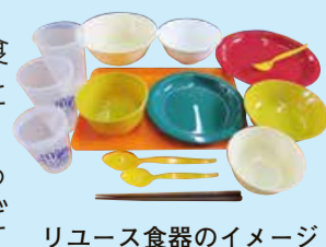
リユース食器のイメージ

新潟市では、皆さんから資源として出されたプラスチックごみをリサイクルしています。