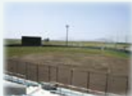
みどりと森の運動公園