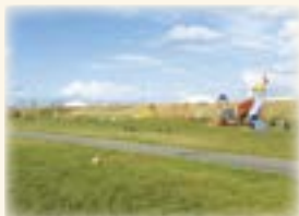
阿賀野川ふれあい公園