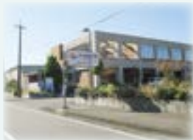
アクアパークにいがた