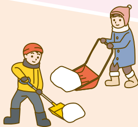
地域の協力による除雪