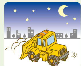
新潟市による道路除雪