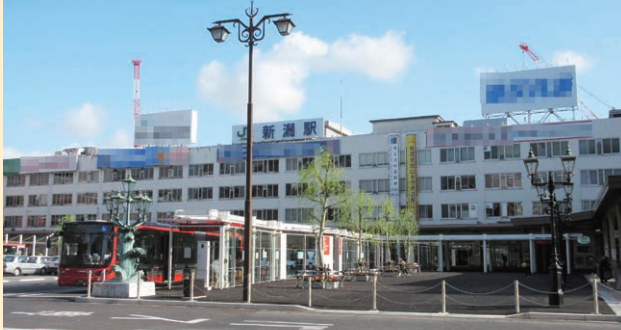
BRT乗車場とあわせて柳やガス灯を配置しました。