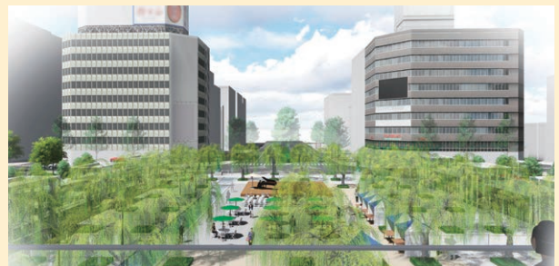
新潟駅デッキテラス(2階)から東大通方向を望む。(イメージ)

※ペDESTリアンデッキ(2階レベルの通路)については、社会情勢の変化を見ながら検討していきます。 ※今後の検討・協議により変更の可能性あります。