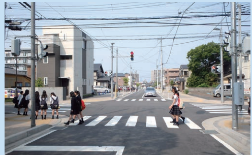
整備後の駅南線(けやき通り)