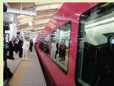
同一乗り換えホームからの特急「いなほ」の出発