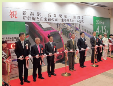
開業セレモニーでのテープカットの様子