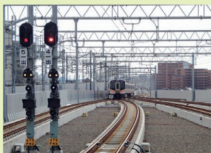
高架橋上を走行する在来線