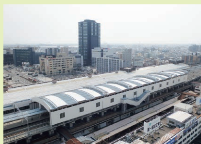
高架駅の施設全景