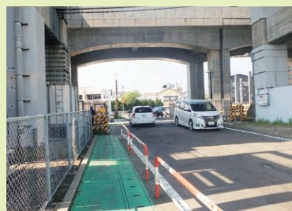
米山と天神尾の2ヶ所の踏切を廃止