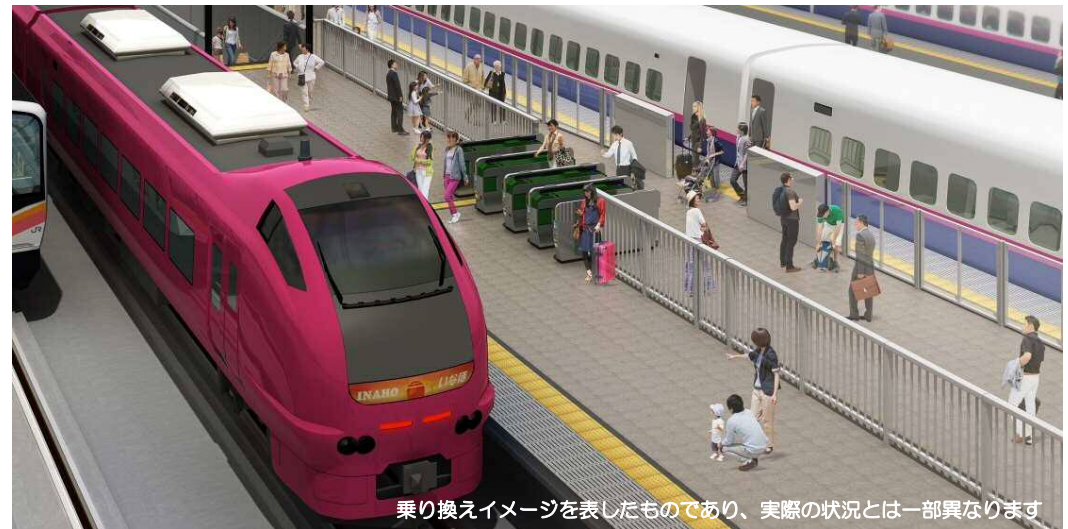
乗り換えイメージを表したものであり、実際の状況とは一部異なります