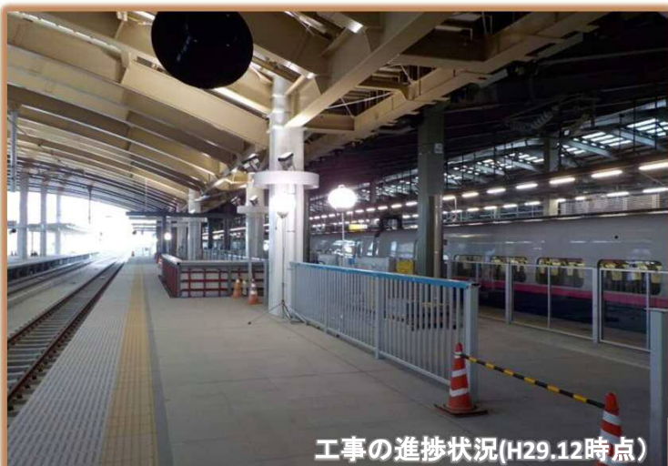
工事の進捗状況(H29.12時点)