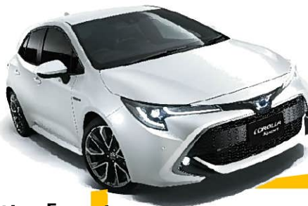
トヨタ 「カローラスポーツ」