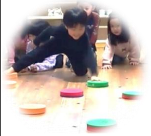
(運動あそびのイメージ)

新潟県「幼児期からの運動習慣アップ事業」、新潟県長岡市「ながおか元気キッズわくわくサポート事業」、新潟県村上市「幼児の体力向上事業」アドバイザーなどの歴任し、新潟県の幼児の体力向上を推進、保育者の身体教育・運動あそび指導方法を提案。現在は、四肢運動による体づくりの研究をすすめ、床ボルダリングの検証をしている。詳細は新潟医療福祉大学附属インターナショナルこども園のInstagram「nuhw_international_kodomoen」をご参照ください。