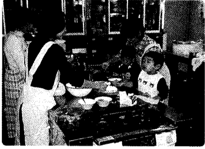
クリスマスケーキ作りの様子