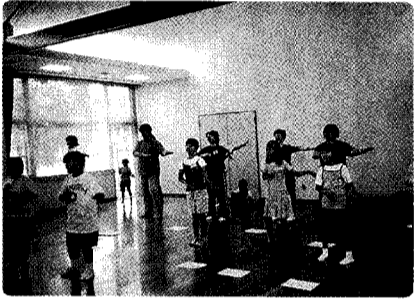
「親子チャレンジ教室」フラダンスに夢中