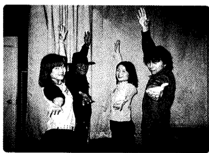
全国パラパラ選手権でも活躍している指導者です。