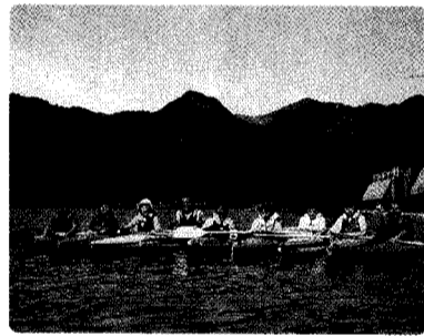
自然との一体感をダイレクトに感じられるカヌー