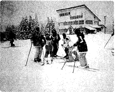
五日町スキー場にて。ハイポーズ!

町民スキー教室 二月二十四日(土)～二十五日(日)、小中学生十五名大人七名の参加者を得て五日町スキー場において町民スキー教室を行いました。 天候はあいにくの雪模様でしたが、到着するなりやる気満々の子どもたちは、早速元気にゲレンデに向かいました。