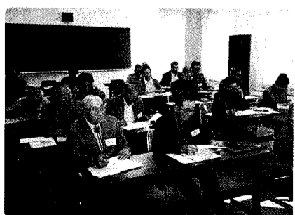
「学校開放講座」熱心に聞き入る受講者