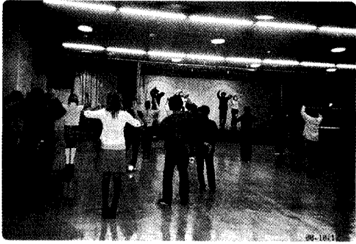
参加者が増え続けた昨年のパラパラ講習会