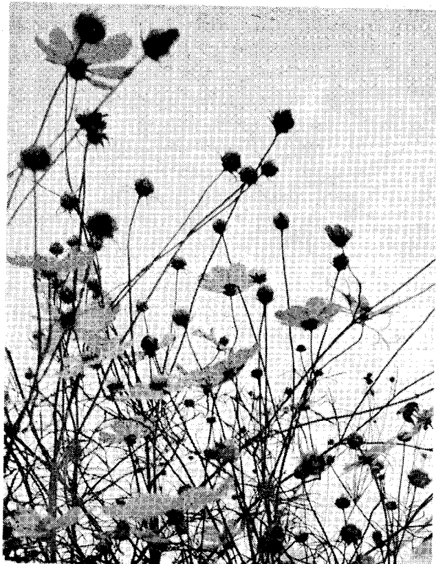
写真コンテスト

本町三丁目の土田古洞氏(八三才)より先ごろ小須戸町に教育基金として、百万円のご寄附があられましたが、このたび同氏に栄えある紺綬褒章が