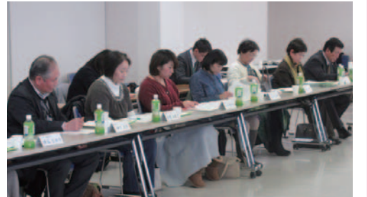
自治協議会本会議 自治協議会での様子