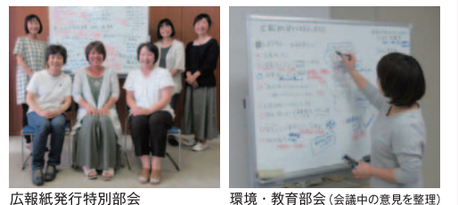
広報紙発行特別部会 環境・教育部会(会議中の意見を整理)

《自治協議会公募委員の四年間》 右も左もわからず入った自治協議会でしたが、子育てのほんのちょっとした悩みや生活している中での困りごとなど、相談することで解決に向かうことがたくさんあるんだと知り、とても勉強になった四年間でした。今年度で任期は終わりますが、ここに集まるみんなが、江南区のことを一生懸命考えて知恵を出し合っているのだということを感じ、もっと多くの方に自治協議会の存在を知っていただけたらと思います。