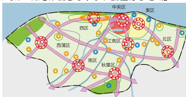
図 都市構造の全体イメージ