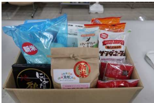
寄贈いただいた物資

○10月27日（水）に「ふるさと江南区宅配便 物資等の贈呈式」を開催し、協賛企業へ、感謝状を進呈した。