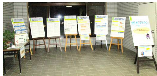
パネル展示の様子