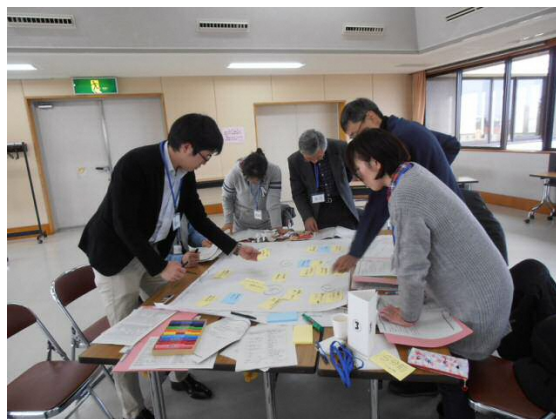
第2回ワークショップの様子