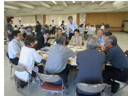
ワークショップの様子

<発行者> 地域別実行計画コミュニケーション事務局 (江南区地域課：TEL025-382-4619 市財産活用課：TEL025-226-2387) 平成29年1月発行