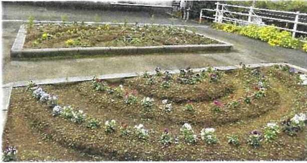
10月7日(土)新崎駅前花壇植栽