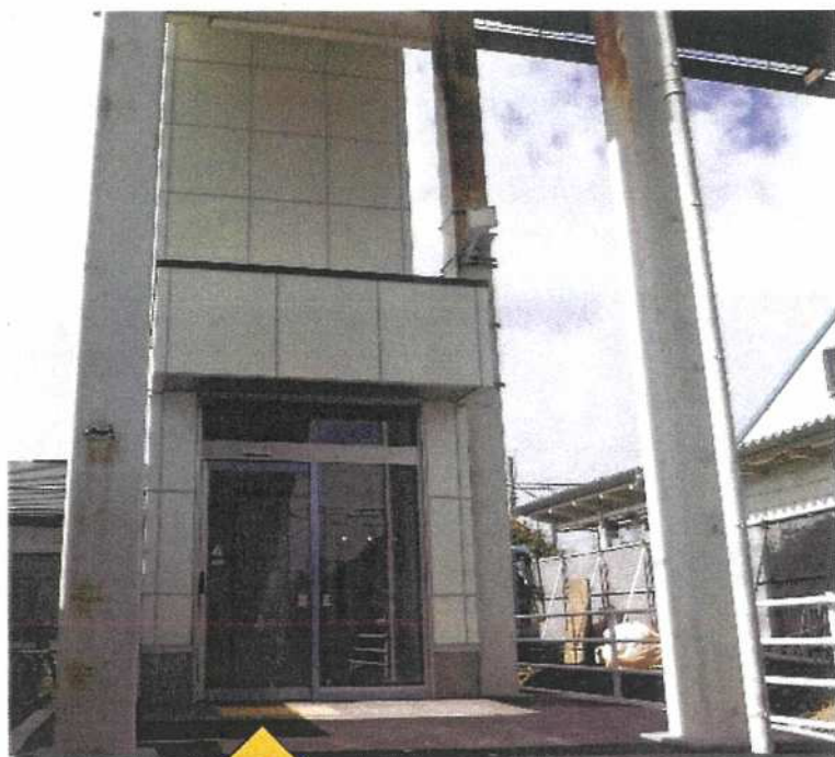
エレベーター出入口