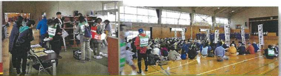
10月15日(日)濁川地区総合防災訓練 濁川小学校・濁川中学校