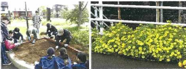
花壇に花苗、プランターはチューリップの球根を植えました。