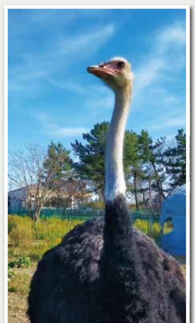
優秀賞 「ダチョウに会える道の駅」

※投稿者名は本人の希望により本名またはInstagramアカウント名等で表記(敬称略)